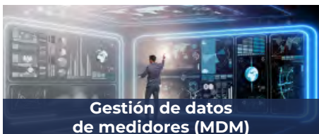
Gestión de datos de medidores (MDM)

Con Open Smartflex, los proveedores de servicios pueden mejorar la relación con sus clientes empleando las últimas tecnologías de autoservicio y centros de atención multicanal, lo que empodera a las nuevas generaciones de clientes y les ofrece una experiencia excepcional. Además, Open Smartflex ofrece aplicaciones avanzadas de ventas y servicio al cliente, así como herramientas de segmentación multidimensional que mejoran las ventas cruzadas, las ventas de servicios complementarios, los programas de fidelización, ahorro e incentivos, entre otros aspectos.