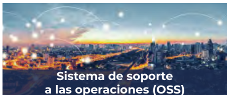
Sistema de soporte a las operaciones (OSS)

Nuestra solución optimiza las agendas de trabajo diario de las cuadrillas y contribuye a mejorar la satisfacción de los clientes al garantizar la priorización adecuada de los trabajos y la rápida finalización de los mismos. Utilizando Open Smartflex, los proveedores de servicios automatizan los procesos de gestión de órdenes de trabajo, incluidas las de terceros, al tiempo que optimizan el uso de los recursos internos y reducen los costos operativos. Al emplear la tecnología móvil de nuestra solución, los trabajadores de campo podrán realizar su trabajo de forma eficiente, accediendo a la aplicación desde cualquier lugar, en cualquier momento y con cualquier dispositivo móvil.