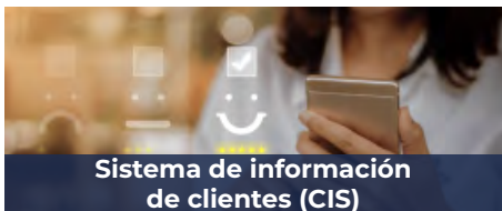
Sistema de información de clientes (CIS)

Nuestra solución soporta la gestión de las interacciones con los clientes y los procesos de la medición al cobro (meter-to-cash). De igual forma, simplifica la gestión de ofertas de servicios innovadores y de estructuras de tarifas emergentes, impulsadas por los prosumidores y la descarbonización del sector energético. Basándose en el robusto motor de facturación de Open Smartflex, los proveedores de servicios se mantienen competitivos y rentables con un sistema que da mejor soporte a la transformación digital de la organización.