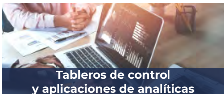
Tableros de control y aplicaciones de analíticas

Open Smartflex proporciona los medios para alcanzar niveles más altos de automatización garantizando el aprovisionamiento y activación oportunos de servicios de telecomunicaciones o basados en IoT. De igual forma, reduce la complejidad de la arquitectura de TI y los costos de integración a través del soporte de diferentes plataformas y tecnologías de comunicación. Esto también permite a los proveedores de servicios públicos tradicionales buscar nuevos mercados con diversos servicios de telecomunicaciones, incluyendo banda ancha, VoIP, telefonía móvil, televisión por cable y plataformas de contenido.