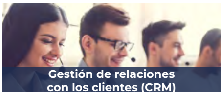
Gestión de relaciones con los clientes (CRM)

Nuestra solución soporta la gestión de las interacciones con los clientes y los procesos de la medición al cobro (meter-to-cash). De igual forma, simplifica la gestión de ofertas de servicios innovadores y de estructuras de tarifas emergentes, impulsadas por los prosumidores y la descarbonización del sector energético. Basándose en el robusto motor de facturación de Open Smartflex, los proveedores de servicios se mantienen competitivos y rentables con un sistema que da mejor soporte a la transformación digital de la organización.