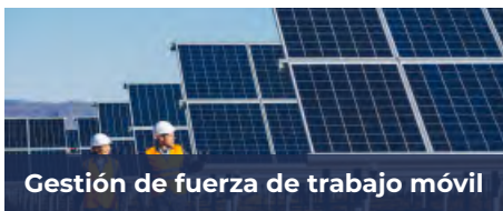
Gestión de fuerza de trabajo móvil

Open Smartflex soporta el manejo de datos de mediciones provistos por las tecnologías AMI y redes inteligentes. La solución gestiona comunicaciones bidireccionales con sistemas head-end, lo que permite la recolección de datos y la ejecución de comandos para medidores inteligentes y plataformas IoT. Además, proporciona capacidades de Validación, Estimación y Edición de consumos (VEE) para garantizar la precisión de la facturación. En consecuencia, las empresas de servicios públicos pueden gestionar modelos de negocio más innovadores, basados en información de consumo confiable, con un enfoque integrado y rentable, manteniendo la lógica de negocio en un único sistema.